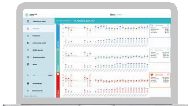
Tableau de bord clinique avec un système d'alertes personnalisables