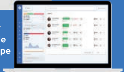
Tableau de bord équipe de soin

Plateforme SaaS Code-Free, Interopérable et à déploiement rapide